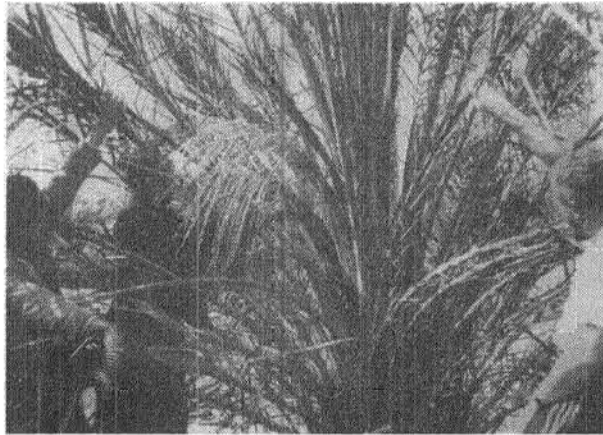
La fécondation selon la méthode anastrale